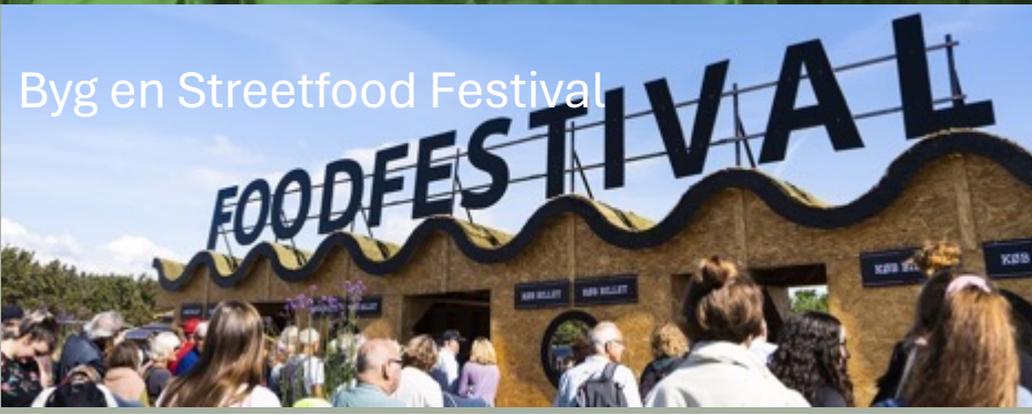
Byg en Streetfood Festival