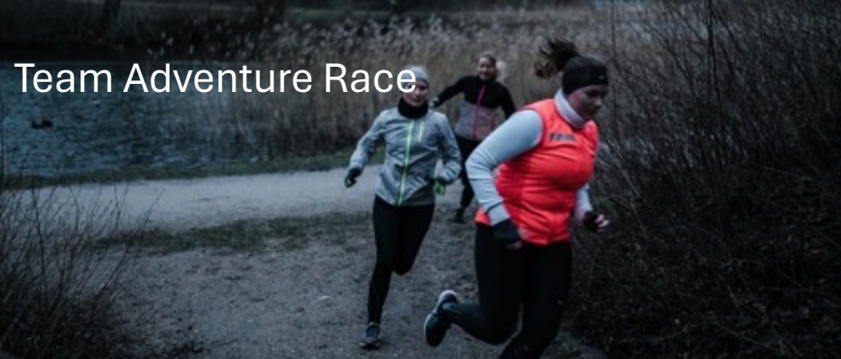
Team Adventure Race